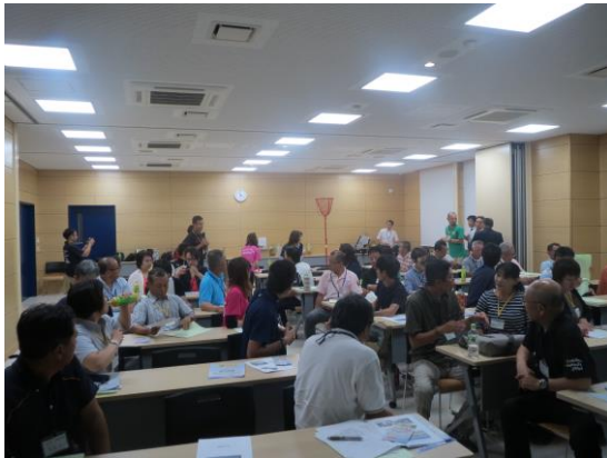
(講演・玉入れタイムレース体験の様子)